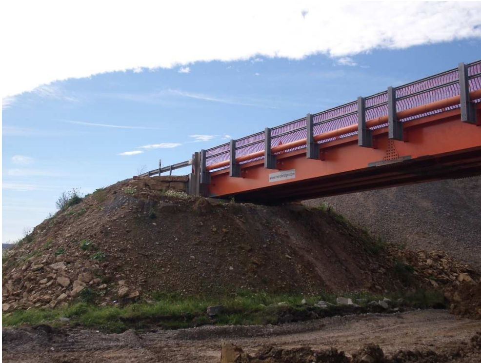
Widerlager mit Anschluss an Behelfsumfahrung