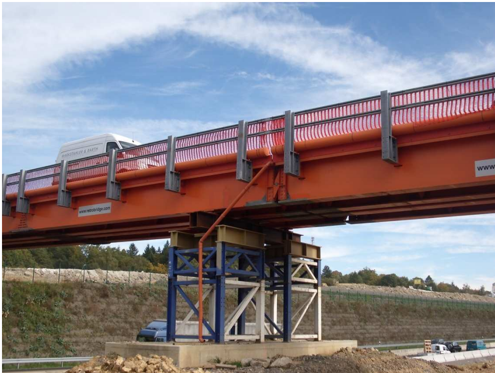
Mittelstützen auf Pfahlgründung sowie Entwässerungsleitung zur Entwässerung des Brückendecks