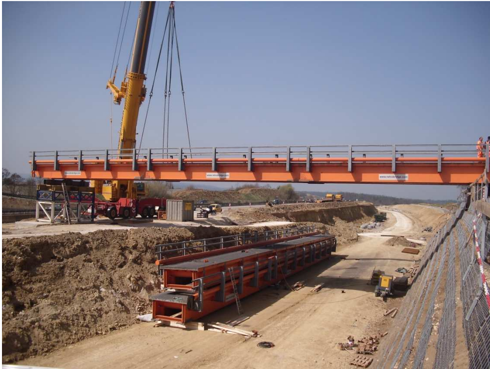
Vormontage sowie Montage des ersten Brückenfeldes mit Mittelstütze über der Baugrube der neuen BAB A8 Trasse