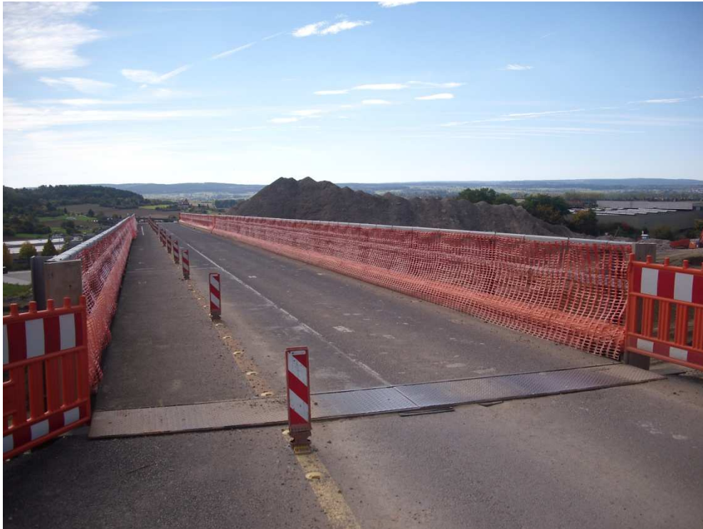
Einteilung des Brückendecks (5,00 m Breite) für Fußgänger, Radfahrer und öffentlichen Verkehr