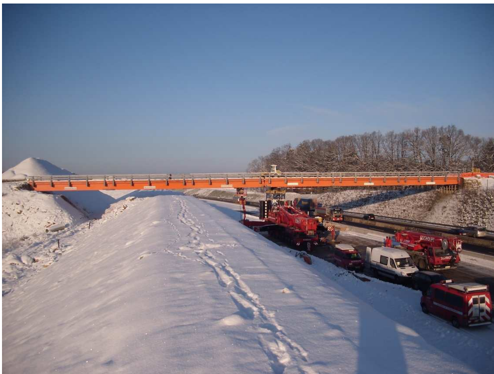
Fertiggestellte und tiefliegende BAB A8 vor der Demontage